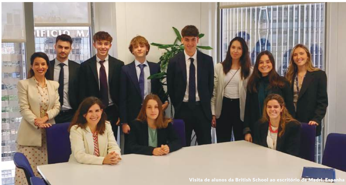
Visita de alunos da British School ao escritório de Madri, Espanha

A Management Solutions mantém acordos de parceria com diferentes colégios de Madri, o que permite que os alunos do ensino médio tenham sua primeira experiência em um