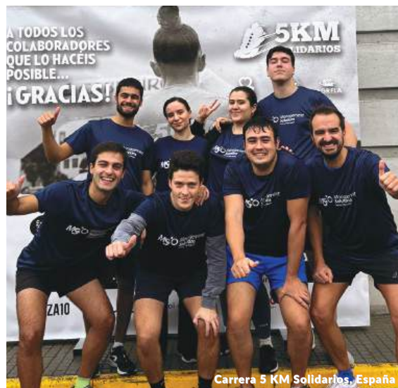
Corrida Solidária de 5 km, Espanha

Sob o lema “As zonas úmidas nos conectam com a natureza na cidade”, a corrida teve como objetivo correr pelas florestas e zonas úmidas do país - já que para cada corredor inscrito na corrida são plantadas três árvores sob o esquema de restauração ecológica, em reservas naturais, de forma perpétua -, bem como conscientizar sobre a necessidade de recuperar as florestas e o respeito ao meio ambiente.