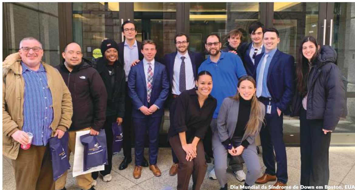
Dia Mundial da Síndrome de Down em Boston, EUA.

Os participantes ajudaram a substituir uma plantação de eucalipto por uma floresta tropical seca para restaurar as