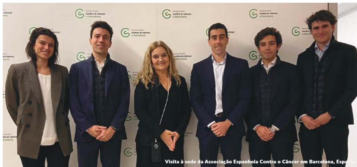
Visita à sede da Associação Espanhola Contra o Câncer em Barcelona, Espanha

ambiente de trabalho. Durante o ano de 2024, os alunos do Colégio Everest, do Highlands Los Fresnos e do Colégio Britânico tiveram a oportunidade de visitar um dos escritórios da Firma em Madri durante três dias, e conhecer seu funcionamento, missão e objetivos, os valores compartilhados pelos profissionais da Management Solutions, bem como os setores em que a Firma atua e as linhas de serviço que oferece, tudo isso por meio de reuniões com profissionais de diferentes perfis e cargos, tendo a oportunidade de ver em primeira mão os diferentes tipos de projetos que estão sendo desenvolvidos e realizando um estudo de caso de consultoria no setor financeiro.