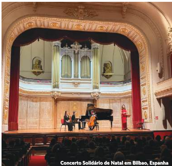
Concerto Solidário de Natal em Bilbao, Espanha

Concerto de Natal da Escuela Superior de Música Reina Sofía em benefício das pessoas afetadas pela DANA, Espanha