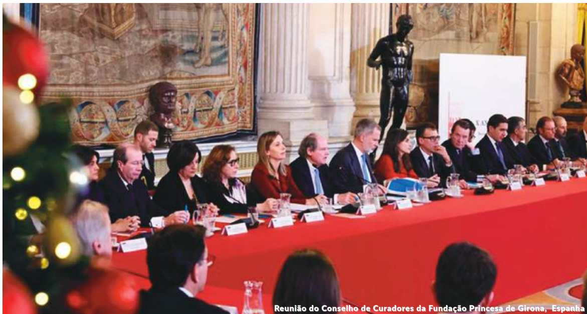
Reunião do Conselho de Curadores da Fundação Princesa de Girona, Espanha

Como sócia protetora do Clube e participante de seu Conselho de Administração, a Management Solutions colabora com seu apoio para o financiamento e a manutenção das diferentes atividades organizadas pelo Clube.