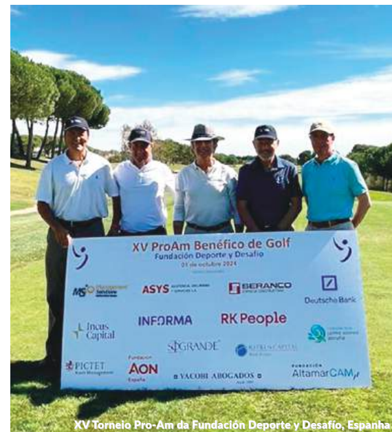
XV Torneio Pro-Am da Fundación Deporte y Desafío, Espanha