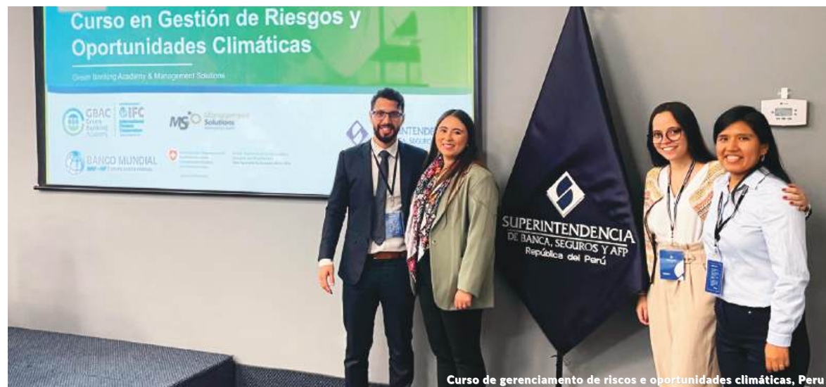
Curso de gerenciamento de riscos e oportunidades climáticas, Peru

energético no processo de transição para uma economia descarbonizada e contribuir para seu desenvolvimento. A Firma também contribui para a Cátedra de Impacto Social da Pontifícia Universidade Comillas, que é apoiada pela Open Value Foundation, a Fundação Repsol, Observatorio Mapfre de Finanzas Sostenibles e a Management Solutions, e tem como objetivo promover o conhecimento, a pesquisa e a inovação em investimentos de impacto, ligando o crescimento sustentável das empresas e o impacto social e ambiental de suas operações e investimentos.