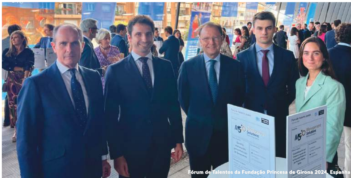
Fórum de Talentos da Fundação Princesa de Girona 2024, Espanha

Durante o evento, que contou com a participação de 150 jovens de 40 das empresas que fazem parte do Patronato, os profissionais da Management Solutions apresentaram projetos relacionados à inteligência artificial (GenMS: acelerando projetos com IA generativa) e à sustentabilidade (Quantificando o impacto social da Escola de Música Rainha Sofia), destacando a experiência da Firma em ambos os campos.