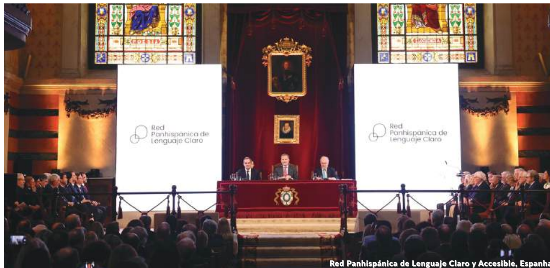
Rede Panhispánica de Lenguaje Claro y Accesible, Espanha

A Rede Pan-Hispânica de Linguagem Clara é uma iniciativa da RAE, com a qual a Management Solutions colabora através da Fundação Pró-RAE, e tem dois objetivos essenciais: promover a linguagem clara e acessível como fundamento dos valores democráticos e da cidadania, e promover o compromisso das autoridades para garanti-la em todos os âmbitos da vida pública. Para atingir esses objetivos, a Rede pretende integrar todas as iniciativas atuais e futuras em defesa do direito fundamental dos cidadãos de compreender as leis e as regras básicas que regulam a convivência social. Também pretende incorporar projetos em favor da acessibilidade do idioma.