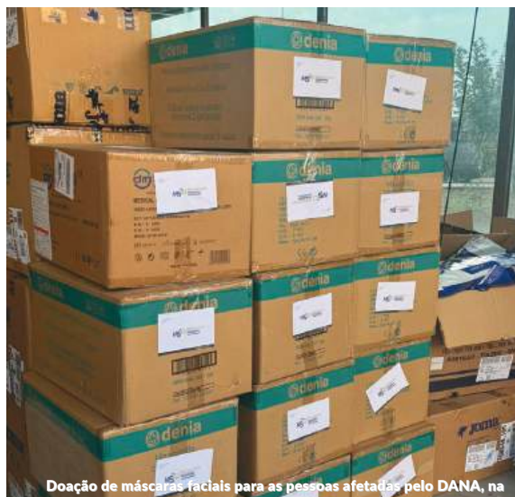
Doação de máscaras faciais para as pessoas afetadas pelo DANA, na