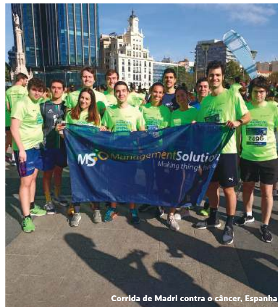
Corrida de Madri contra o câncer, Espanha