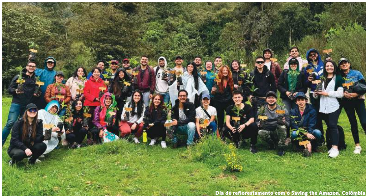
Dia de reflorestamento com o Saving the Amazon, Colômbia

A AECC é uma ONG fundada em 1953 que reúne pacientes, familiares, voluntários e profissionais que trabalham juntos para