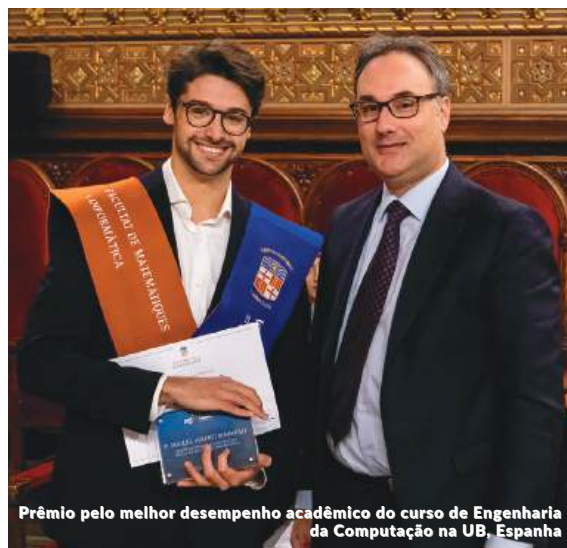
Prêmio pelo melhor desempenho acadêmico do curso de Engenharia da Computação na UB, Espanha

O prêmio, concedido por seu trabalho "Data process monitoring system for industrial environments based on cloud services", buscou reconhecer o TCM mais inovador na área de transformação digital, valorizando especialmente as tecnologias propostas, a capacidade inovadora das soluções obtidas e sua aplicação no mundo dos negócios.