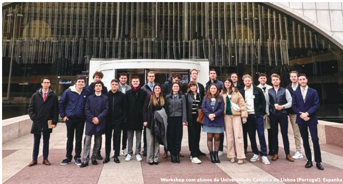
Workshop com alunos da Universidade Católica de Lisboa (Portugal), Espanha

Durante 2024, a Management Solutions continuou fortalecendo seus vínculos de parceria com algumas das principais universidades da Europa. A Firma ministrou seminários, workshops e outros eventos em universidades de referência, como a Universidade de Cambridge, a Universidade de Londres, o Imperial College London e a Universidade de Bath, no Reino Unido; Universidad Carlos III, Universidad Complutense de Madrid, Universidad Pontificia Comillas, Universidad de Deusto ou ESADE, na Espanha; Sorbonne University, na França; Tillburg University, na Holanda; Goethe University, na Alemanha; Università Bocconi, na Itália; e BI Norwegian Business School, em Oslo; para citar apenas algumas. Durante el evento los estudiantes pudieron conocer de primera mano el funcionamiento de nuestra Firma, qué hacemos y cómo lo hacemos, explorar oportunidades de crecimiento profesional alineadas con sus ambiciones y conocer de primera mano los desafíos actuales de la gestión empresarial.