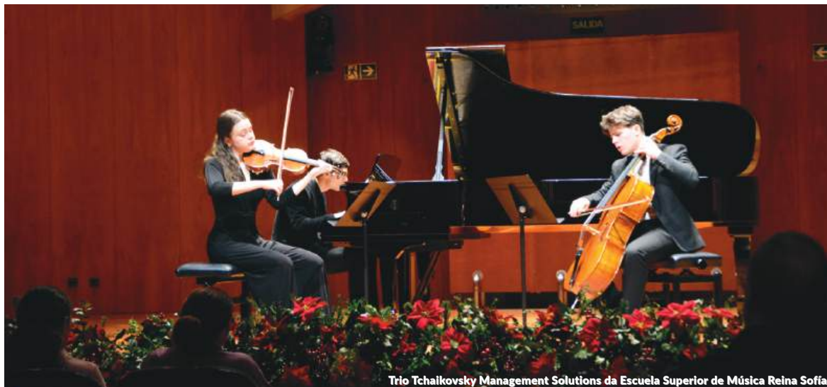
Trio Tchaikovsky Management Solutions da Escuela Superior de Música Reina Sofía

A Management Solutions destinou 60.000 euros ao plano elaborado pela FPDGi para a recuperação da rede de apoio aos jovens de Valência após o desastre, além da colaboração direta dos profissionais da Firma na execução e coordenação do referido plano.