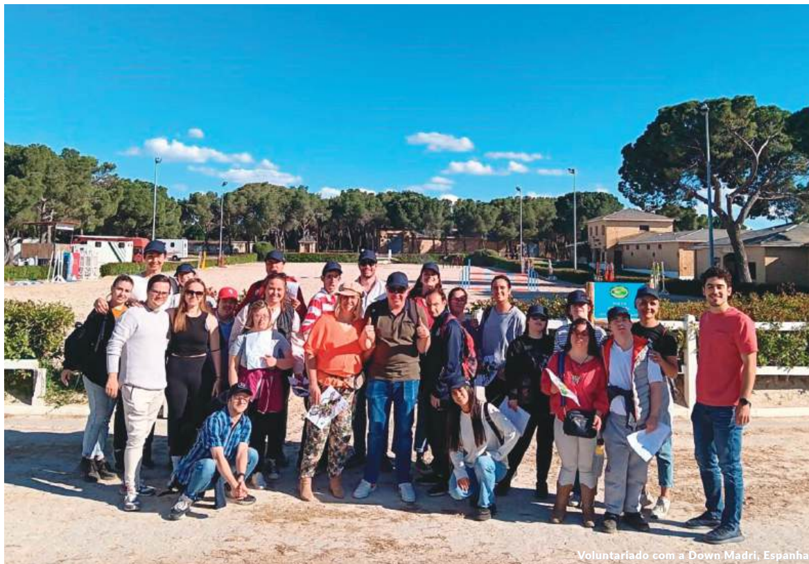
Voluntariado com a Down Madri, Espanha

A Management Solutions assinou diversos acordos de parceria com diversas fundações e instituições que promovem causas solidárias, de empreendimento ou integração social