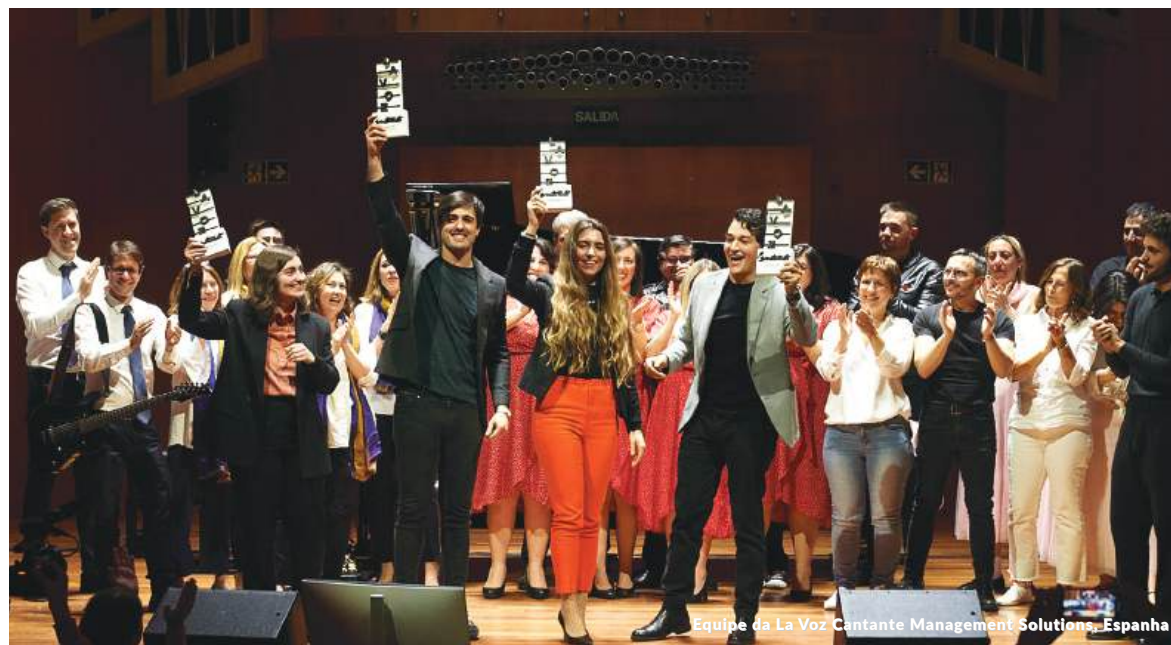
Equipe da La Voz Cantante Management Solutions, Espanha

Este acordo destaca a importância da música de conjunto na formação de um músico como complemento indispensável de suas habilidades como solista e de sua participação em uma orquestra. Além disso, ressalta o compromisso da Management Solutions com valores compartilhados, como qualidade, esforço e desenvolvimento de talentos, bem como seu apoio incondicional às artes e à música.