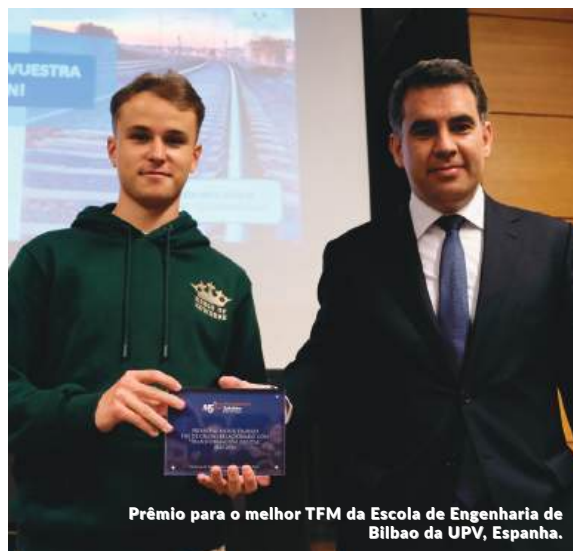
Prêmio para o melhor TFM da Escola de Engenharia de Bilbao da UPV, Espanha.

Prêmio para o melhor TCM da Escola de Engenharia da UPV Bilbao