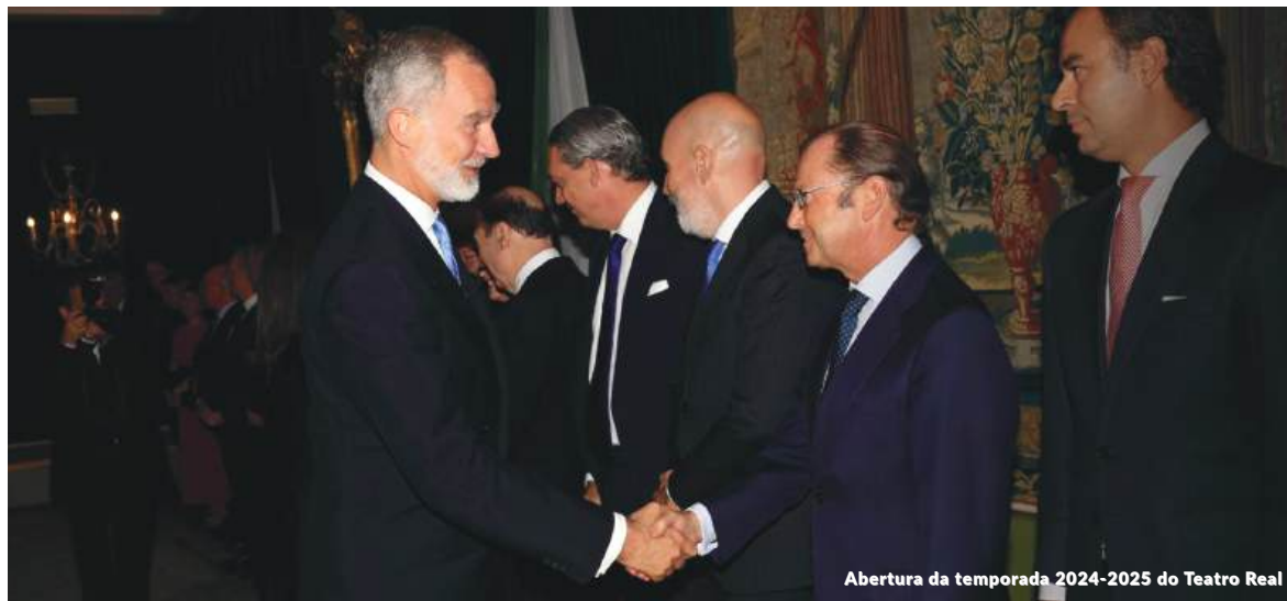
Abertura da temporada 2024-2025 do Teatro Real

Com o objetivo de apoiar jovens talentos musicais, a Management Solutions e a Fundação Albéniz assinaram um acordo de parceria em 2021 na área de formação de música de câmara na Escola Rainha Sofia, sob o qual a Firma vem apoiando um dos conjuntos de câmara da Escola desde então.