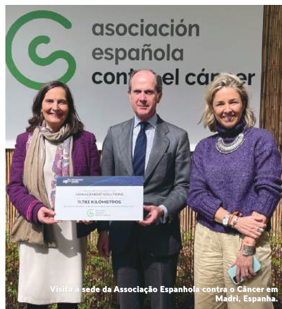
Visita à sede da Associação Espanhola contra o Câncer em Madri, Espanha.