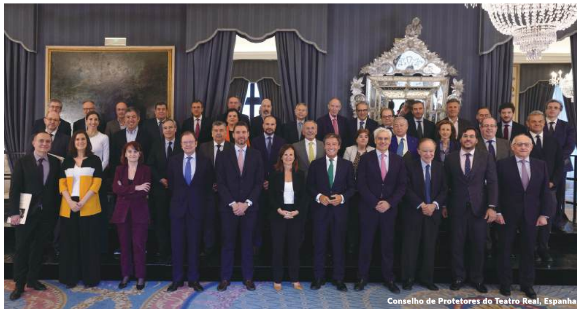
Conselho de Protetores do Teatro Real, Espanha