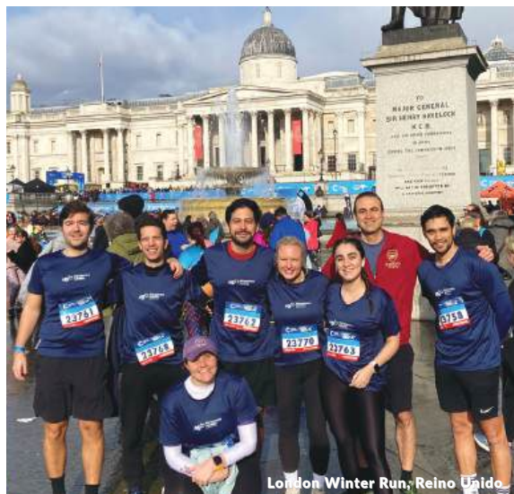
Carrera Verde 2024, Colombia

Mais de 70 profissionais da Management Solutions participaram da Corrida Verde 2024, realizada em Bogotá e organizada pela Fundação Natura (uma organização da sociedade civil dedicada à conservação, uso e gestão da biodiversidade para gerar benefícios sociais, econômicos e ambientais).