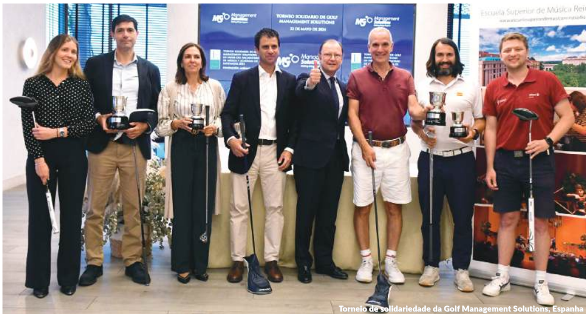
Torneio de Solidariedade da Golf Management Solutions, Espanha

O Grupo de Ação Social organizou duas iniciativas de voluntariado em colaboração com a Área de Lazer de Down Madri, uma associação que ajuda a melhorar a qualidade de vida das pessoas com deficiências intelectuais. Durante as iniciativas, grupos de voluntários da Management Solutions puderam compartilhar uma tarde divertida em um centro equestre com um grupo de jovens com síndrome de Down e outras deficiências intelectuais.