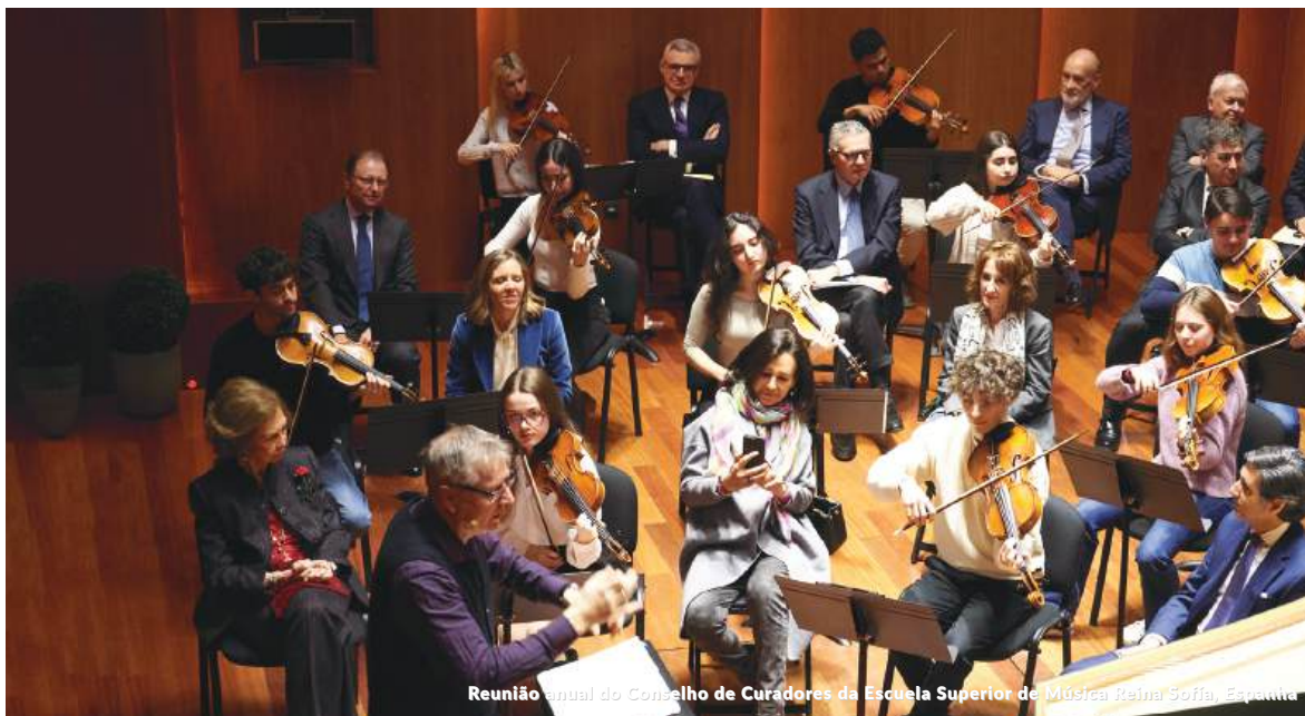
Reunião Anual do Conselho de Curadores da Escola Superior de Música Reina Sofia, Espanha

Através do desenvolvimento deste acordo, a Management Solutions apoia a criação de um grupo de câmara dentro da Escola Rainha Sofia, que levará o nome da entidade a partir do ano académico 2021-2022, o “Tchaikovsky Trio Management Solutions”.