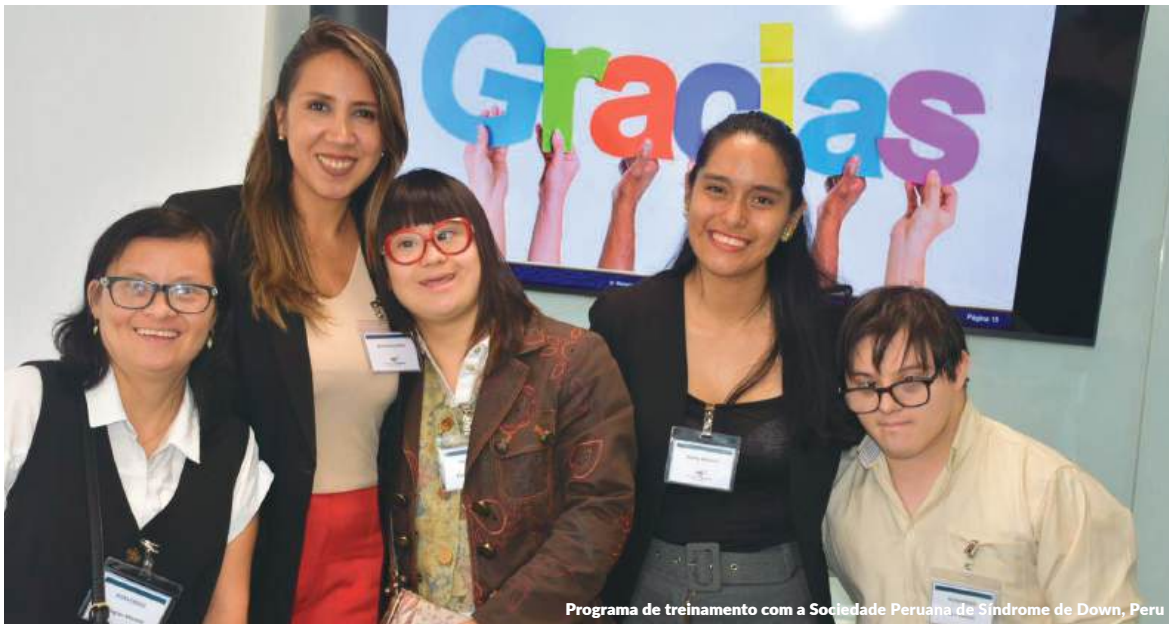
Programa de treinamento com a Sociedade Peruana de Síndrome de Down, Peru