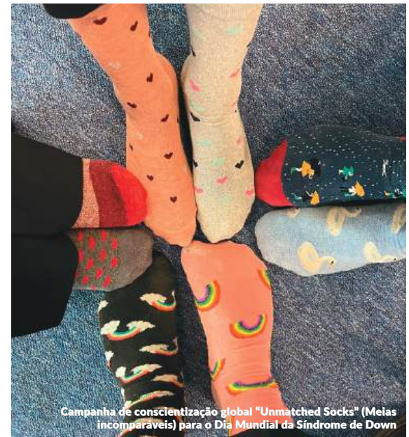
Campanha de conscientização global "Unmatched Socks" (Meias Incomparáveis) para o Dia Mundial da Síndrome de Down