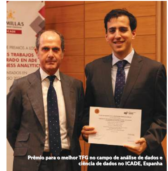
Prêmio para o melhor TFG no campo de análise de dados e ciência de dados no ICADE, Espanha