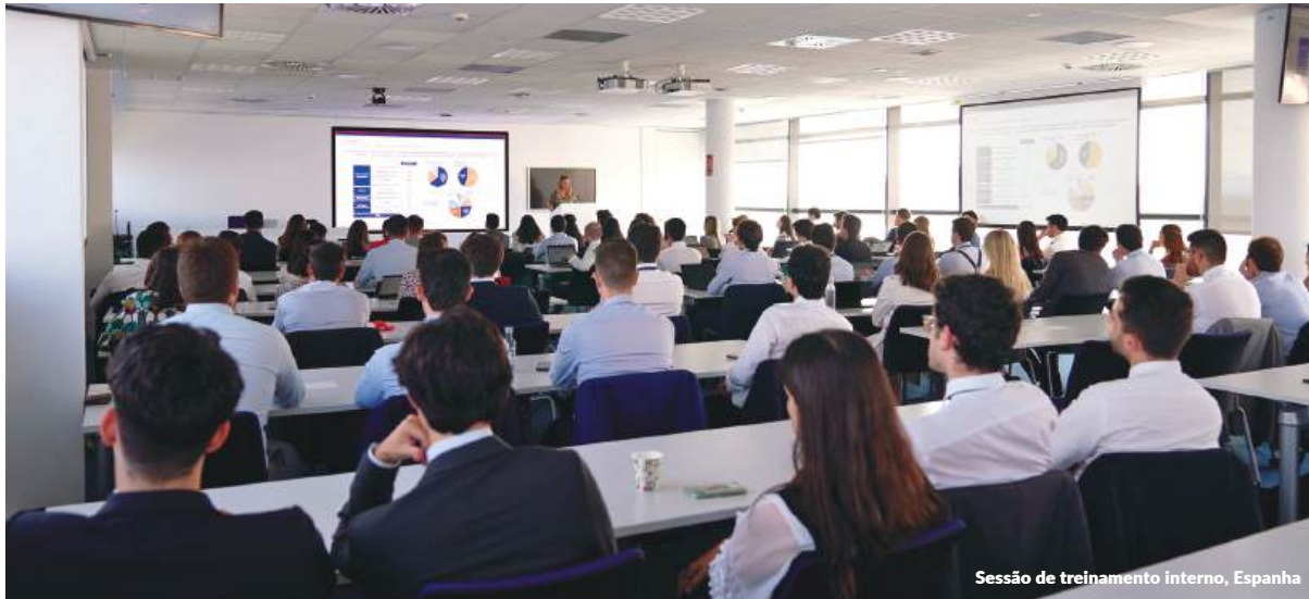
Sessão de treinamento interno, Espanha