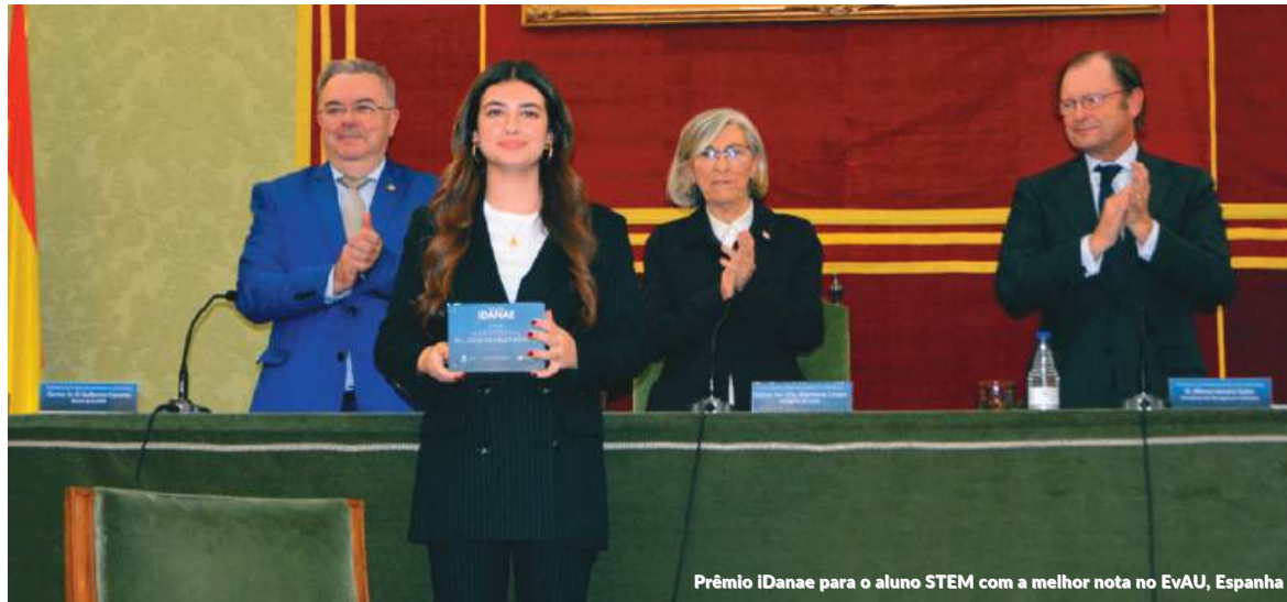
Prêmio iDanae para o aluno STEM com a melhor nota no EvAU, Espanha